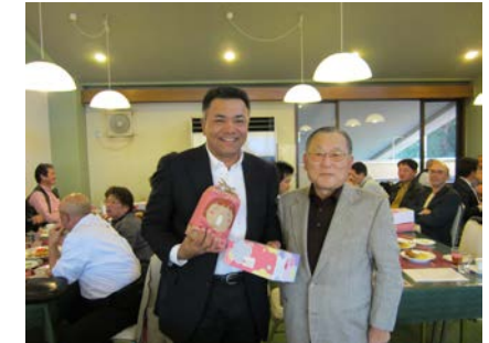
(オープンゴルフ優勝者(左)と出野副理事長)