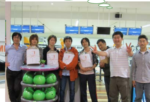
(ボウリング大会優勝チーム)