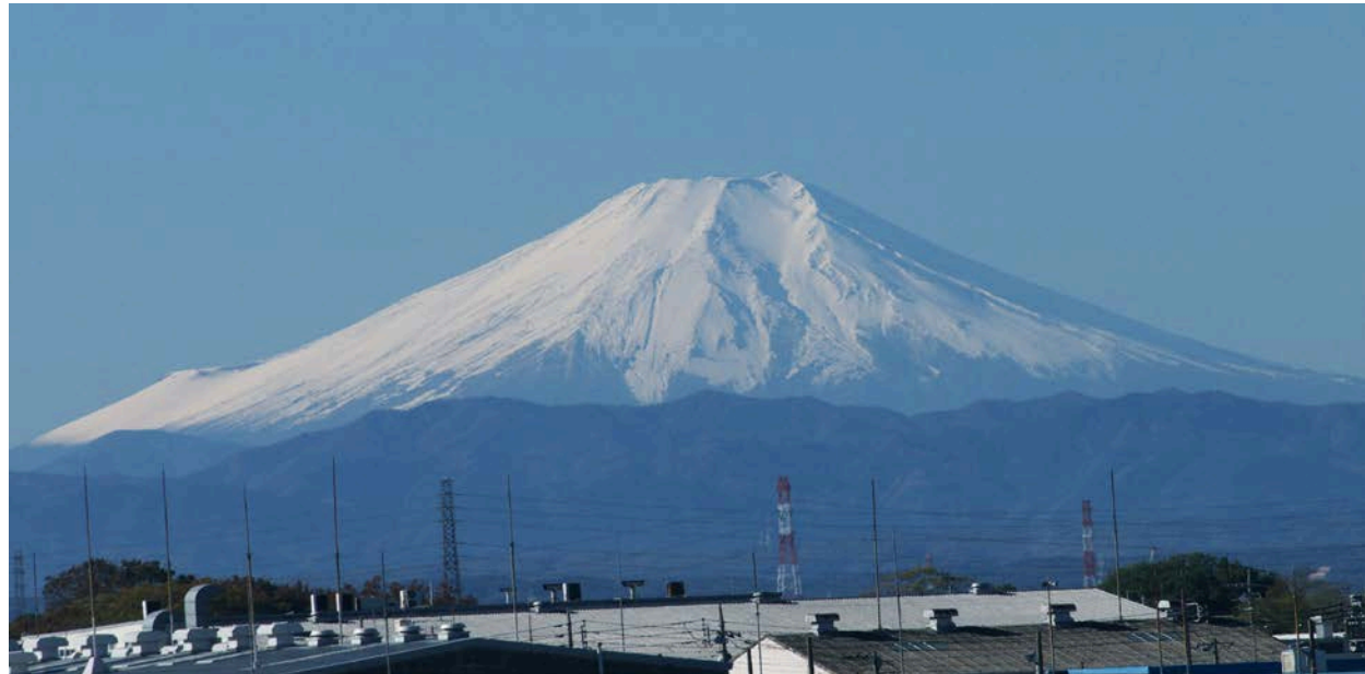
工業団地越しに富士山を望む

発行日 平成24年12月1日 (3.6.9.12月の年4回発行) 所在地 〒350-0833 川越市芳野台1丁目103番57 TEL 049-224-6602