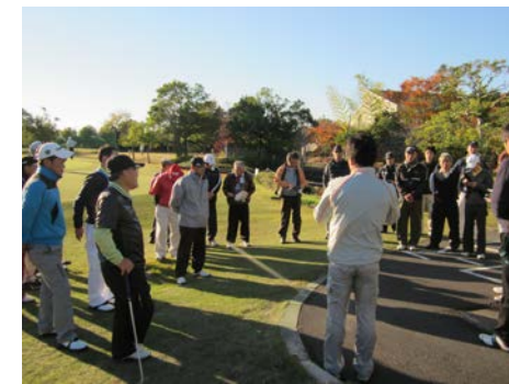
(オープンゴルフ開会風景)