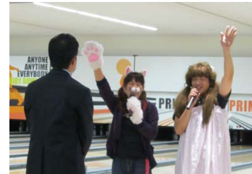
(ボウリング大会宣誓風景)